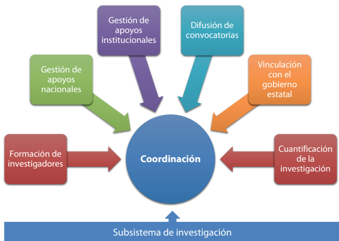
Figura 2. Sistema de Educación Superior