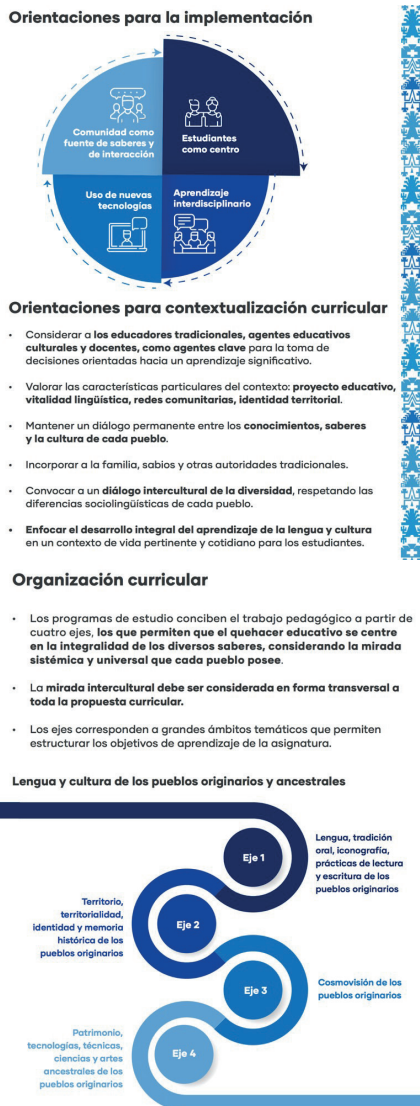
Figura 1. Características de la asignatura Lengua y Cultura de los Pueblos Originarios Ancestrales